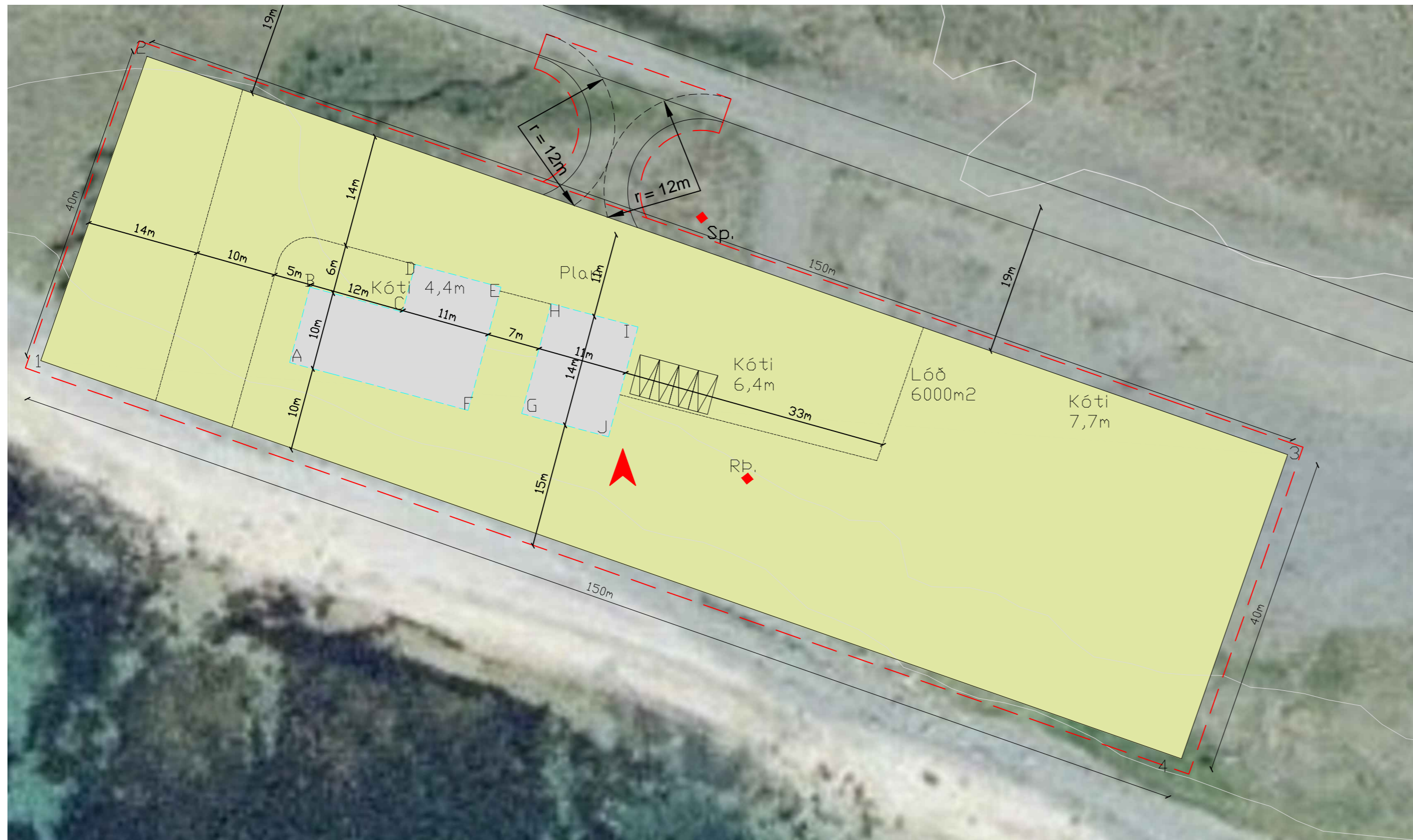
Byggingarreitur Kvarði 1:500