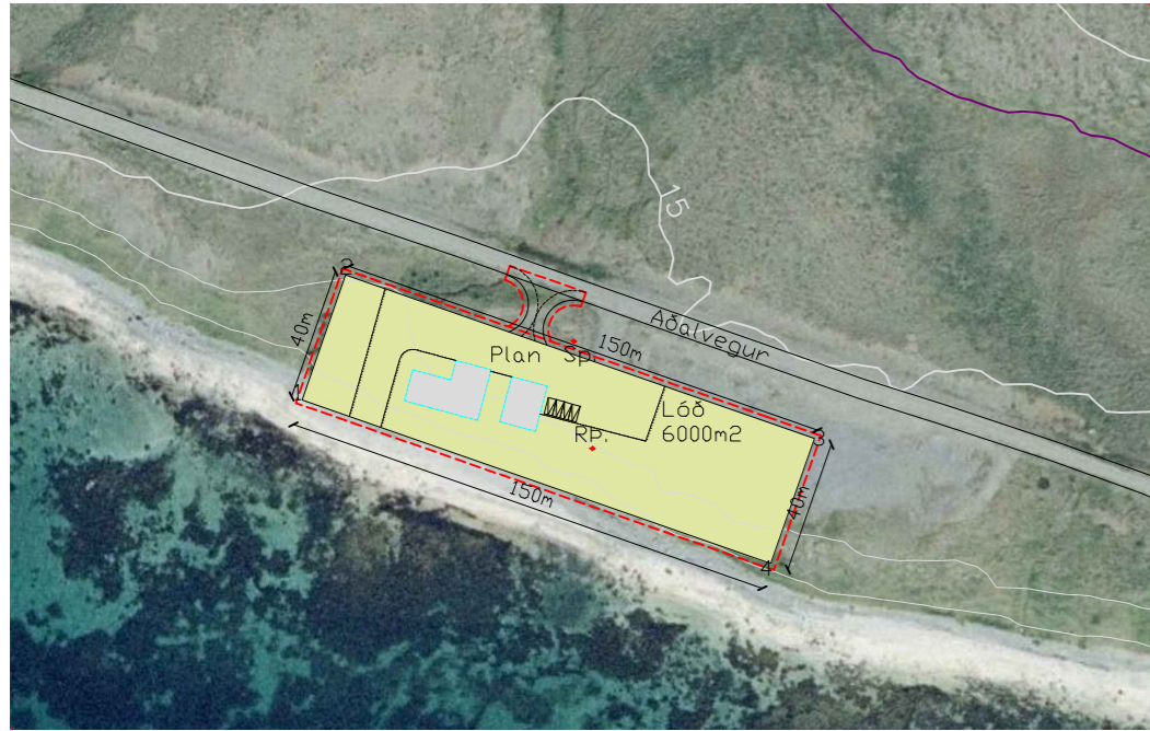
Yfirlitsmynd: Kvarði 1:2500